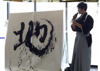
【出展:2016年G7サミット市民社会プラットフォームHP】