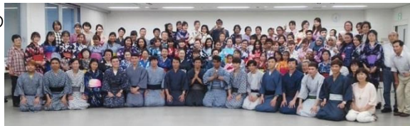
浴衣会 全員で笑顔いっぱい記念撮影↑

西日本豪雨では呉も甚大な被害を受けましたが、SNS等を活用しいち早く学習者の安否確認、ニーズ把握ができたそうです。また、学習者たちは被災した地域の瓦礫撤去など復興にも貢献してきました。呉に住み、日本語教室を通じて地域と繋がり、地域に暮らす一市民として、お世話になっている自分たちも貢献したいと思い、それを伝える行動できるのも、日ごろの教室での双方向の取り組みや、地域との繋がりを深める工夫が生きていてと感じます。今後、各地で更に外国人が増えことが予想されます。「日本語教室」を軸に外国人住民の学習の場であると共に、地域づくりをすすめる呉の取り組みから学ぶことがたくさんあるのではないのでしょうか。