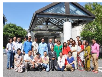
↑各国から集まった国際研修の参加者と。

まず、特に印象に残ったことは、39年の間に研修生との関係が変化・発展していることです。アジア各国からNGO職員を主対象に研修生を受け入れる国際研修が主な活動であることは当初から変わりませんが、以前の研修生が母国で活躍するにつれ、現地で彼らと協働することがAHIの重要な活動になってきています。アジア各国にちらばる研修生同士の連携も生まれ、AHIというプラットフォームを介して国をまたいだコミュニティが形成されていること、彼らの自主性を重んじながら、優しく包み込むようにそと支援の手を差し伸べていっしやる姿勢が大変印象的でした。